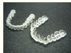
ホームホワイトニングのトレー

ホワイトニングで一度歯を白くしても、やがてまた元の色に近づいていきます。これを「後戻り」といいます。もちろん個人差はありますが、一般的にはオフィスよりもホームの方が後戻りしにくく、しかもホワイトニングしたときの「白の質感」もホームの方がきれいなことが多いようです。