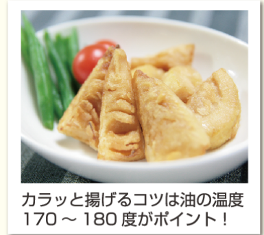
カラッと揚げるコツは油の温度170～180度がポイント！