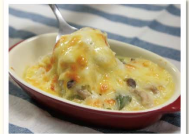
加熱用のカキを使用する場合は、しっかり火を通しましょう