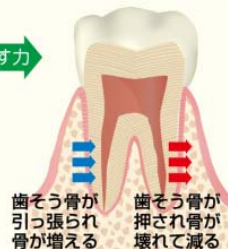
歯槽骨が引っ張られ骨が増える 歯槽骨が押され骨が減る

ですから、一方向から歯に力をかけると、歯に圧迫された骨が壊れて減り、その方向に歯が動くんです。