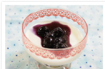
ポイント 他のくだものソースと合わせてみるのもいいですね