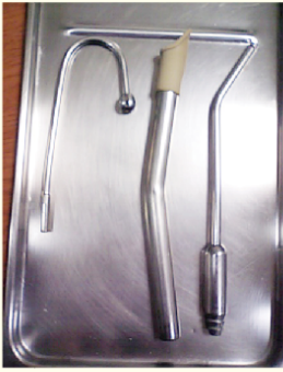
バキュームの先端の形は、使い方や目的によってさまざま。

バキュームの難しさがお分かりいただけましたか？でも、治療中にお口の中に水や唾液がたまり苦しくなったら、いつでも遠慮せず、左手を上げて合図をしてください。